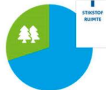
Maximaal 70% Saldo-ontvangende bedrijven mogen tot 70% van het saldo van de saldo-gever overnemen. De overige 30% van de gerealiseerde capaciteit wordt ingetrokken en komt ten goede aan de natuur.