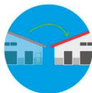
Saldo-gevers & saldo-ontvangers Het bedrijf dat stopt noemen we de saldo-gever. Het bedrijf dat de emissie overneemt noemen we de saldo-ontvanger.

70% van de stikstofemissie overnemen. 30% teruggeven aan natuur.